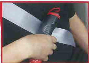
シートベルト カッター