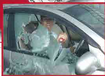
ガラス破碎先端部