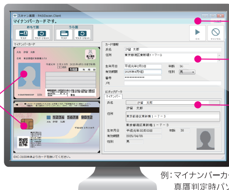
例：マイナンバーカードの 真贋判定時パソコン表示画面