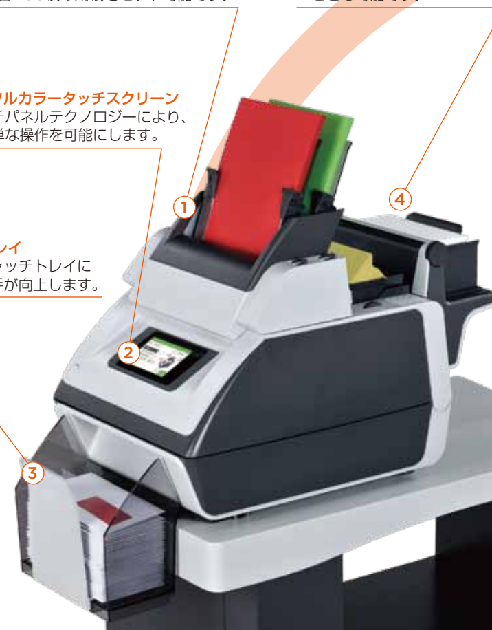
※2.5ステーションの場合