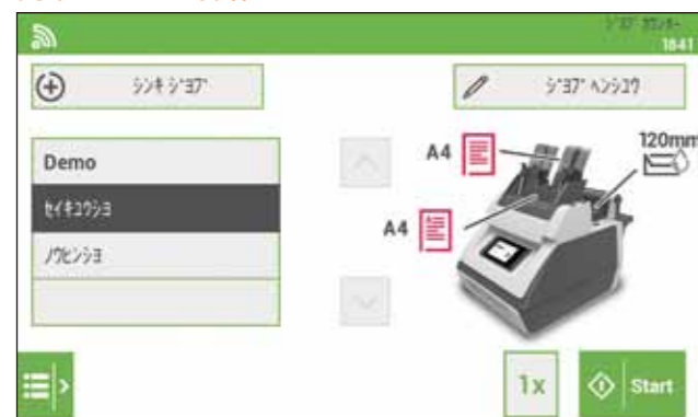
①書類と封筒をセットし、ジョブを選択