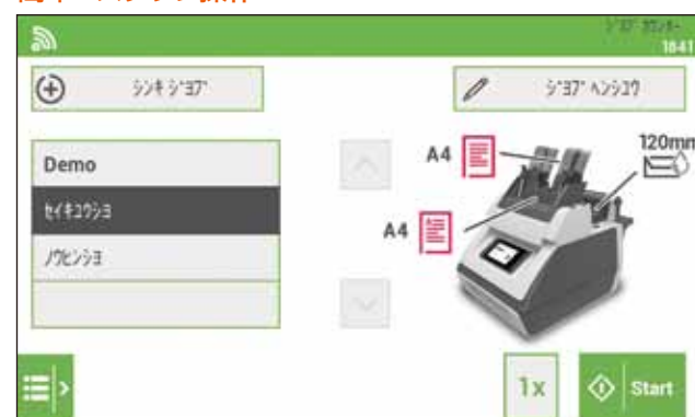
①書類と封筒をセットし、ジョブを選択