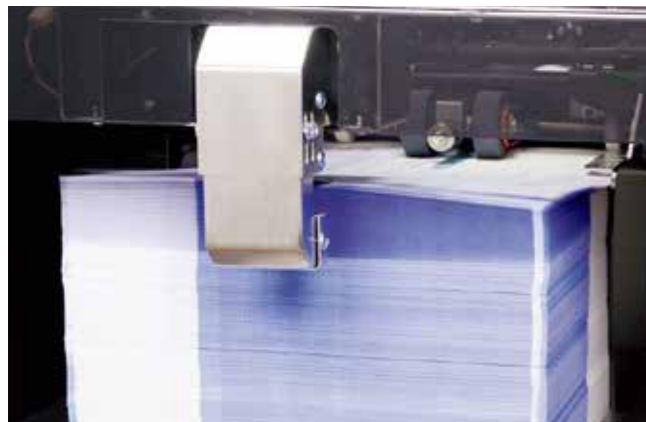
給紙部の送風装置（ブローア）により、給紙の安定性がアップ。