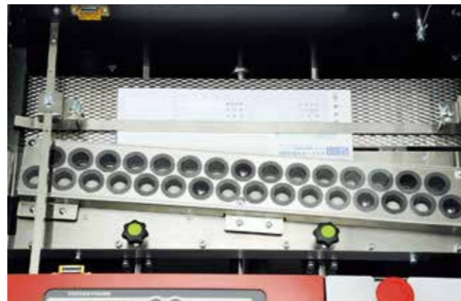
アライニング装置による軌道修正機能により、処理のロス率を低減。