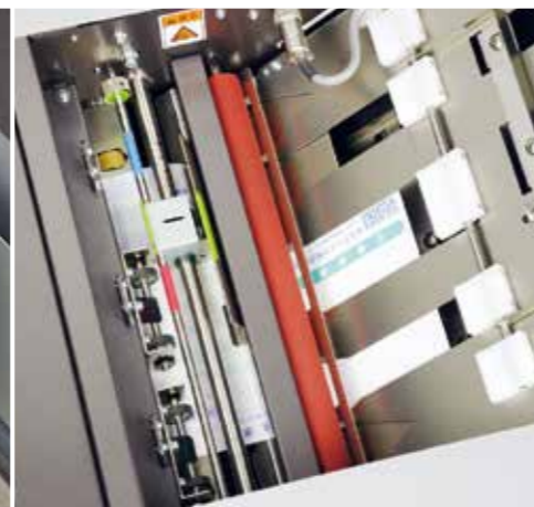
スリッター（オプションで、電動スリッターにすることも可能）