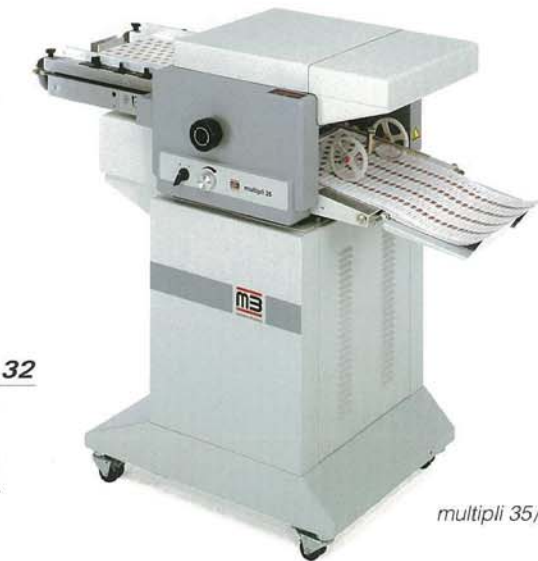
multipli 35/2 S