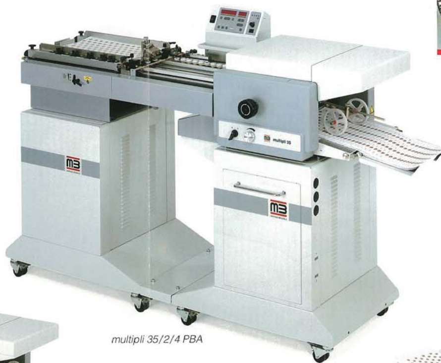
multipli 35/2/4 PBA

サクシンドラムで、積載物の一番下からフィードしていきますので、連続して上積み給紙が可能です。