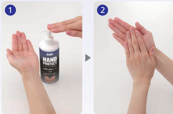
① ワンプッシュで適量を手にとります

作業前の他、昼休み、業務後にお使いください。 水分を補う必要性を感じた時にもお使いください。