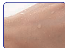
ハンドプロテクトをつけていない肌 ハンドプロテクトをつけた肌