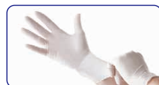
ラテックス手袋を使用の際もご使用いただけます

ゴージャー® ハンドプロテクトは、通常の使用においてはラテックスを痛めません。(手袋に擦り込み3時間放置後のJIS T 9107試験で確認)