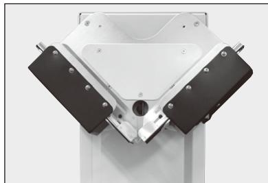
小サイズアタッチメント(オプション)