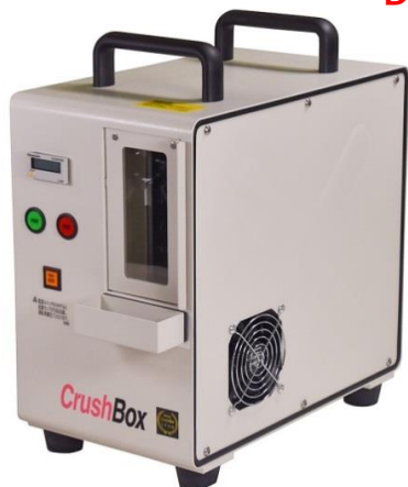
HA-50 V字破壊アダプタ付属

日本シェア90% DB-60PRO用SSDアダプタを新発売 DB-OP-60SSD